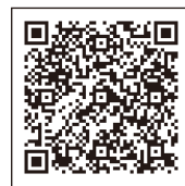
사도 관광 나비